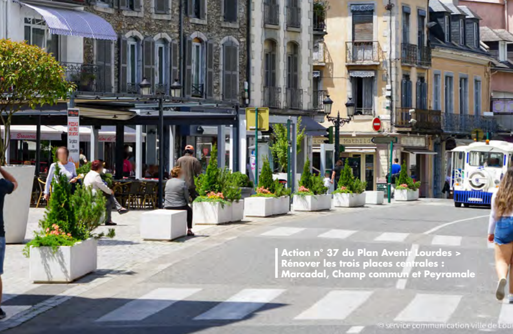
Action n° 37 du Plan Avenir Lourdes > Rénover les trois places centrales : Marcadal, Champ commun et Peyramale