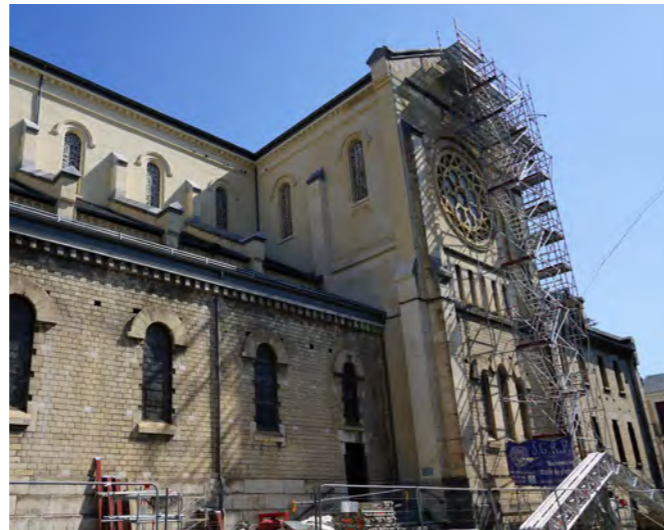
EMBELLIR LA VILLE & ENTREtenir LE PATRIMOINE

Ce nouvel ouvrage d'art, sera le symbole du nouveau visage de Lourdes, unifiant les différentes parties de la ville. Le lancement des études et le concours d'architecte sont actés.