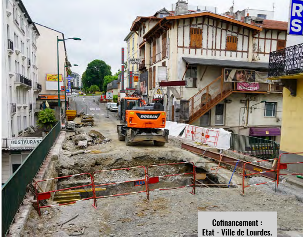
Cofinancement : Etat - Ville de Lourdes.

Montant des travaux 170 000 € HT (y compris maîtrise d'œuvre)