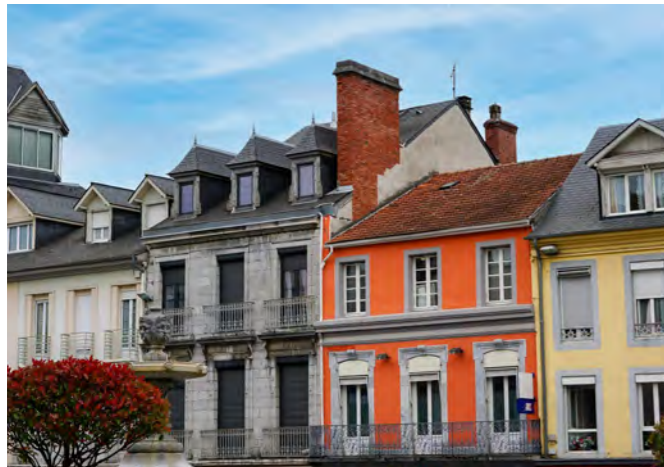
UN PLAN FAÇADES 2022 > 2025