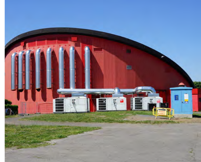
AMÉLIORER LES ÉQUIPEMENTS PUBLICS & SPORTIFS