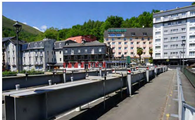
RECONSTRUCTION DU PONT PEYRAMALE 2022 > 2025 + de 5 M€

Améliorer le cadre de vie, requalifier l'espace urbain et rendre la Ville plus attractive. Action n°45 du PAL, le plan Façades engagé pour la période 2022 - 2025 se concentre, dans un premier temps, sur le périmètre situé des Halles à la place Marcadal. Le dispositif financier incitatif mis en place par la Ville invite les propriétaires privés à engager la rénovation de leurs façades et devantures commerciales. Le périmètre sera étendu par la suite.