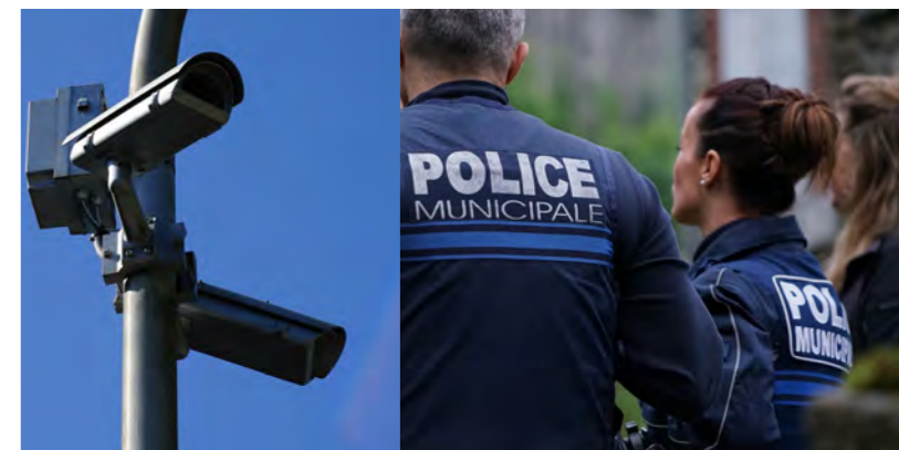
VEILLER À LA SÉCURITÉ