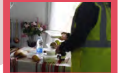
Le CCAS dispose d'un budget annexe